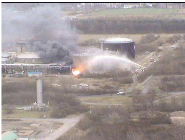
Figure 3 : accroissement de la flamme en direction de la vanne hydraulique et du by-pass. Tout semble indiquer que la flamme est alimentée par l'huile hydraulique du réservoir de la vanne.

À 14h36, la flamme a quasiment disparu à la suite de la baisse de pression. Mais, à partir de 14h38, elle se ravive et brûle la vanne hydraulique, située à seulement deux mètres du joint isolant. La reprise du feu est probablement due à la destruction du réservoir de liquide hydraulique de la vanne, à la suite de la température élevée de la flamme. Peu de temps auparavant, la brigade de pompiers avait commencé à refroidir les réservoirs d'acrylonitrile pour éviter leur inflammation. Un peu d'eau de refroidissement a peut-être coulé vers le pipeline en flammes du fait de la faible distance qui le sépare du réservoir voisin. Quelques secondes plus tard, la vanne hydraulique et le by-pass brûlent tous les deux (Figure 3).