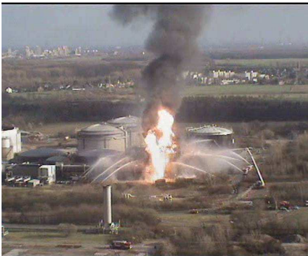
Figure 5 : toute la zone de la toiture du réservoir d'acrylonitrile est en feu à 16 heures 30.

Les habitants des districts voisins de Cologne invités à fermer portes et fenêtres. Mais, à ce moment, le nuage de fumée grimpe en flèche jusqu'à 700 m d'altitude sous l'effet de l'ascendance thermique. Grâce à un considérable déploiement d'unités de mesure, la dissémination du nuage formé est soigneusement tracée. À cette fin, la brigade de pompiers est aussi aidée par l'unité de mesure, parfaitement équipée, de l'Agence régionale de protection de l'environnement. À certains points de mesure, des résultats positifs sont obtenus pour les oxydes nitriques et l'acide cyanhydrique mais, les seuils de détection de 2-5 ppm pour le NOx et 2 ppm pour le HCN ne sont pas dépassés.