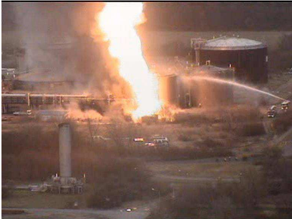
Figure 4 : flamme d'éthylène jaillissant du by-pass cassé de la vanne. Pression du gaz : 83 bars. Une demi-heure plus tard, le réservoir d'acrylonitrile prend feu à son tour.

À partir de 16h30, toute la zone de la toiture du réservoir est en feu (Figure 5). Les flammes atteignent une hauteur de 16 à 20 mètres. À ce moment, une quantité d'environ 35 000 litres par minute d'eau de refroidissement est utilisée pour éteindre l'incendie et refroidir les réservoirs voisins.