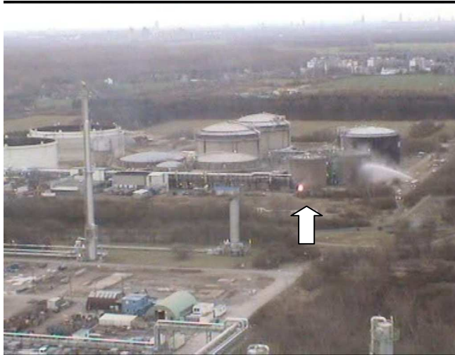
Figure 2 : flamme d'éthylène au niveau de la fuite sur le joint isolant (flèche) et refroidissement des réservoirs d'acrylonitrile par la brigade de pompiers.

À 14h36, la flamme a quasiment disparu à la suite de la baisse de pression. Mais, à partir de 14h38, elle se ravive et brûle la vanne hydraulique, située à seulement deux mètres du joint isolant. La reprise du feu est probablement due à la destruction du réservoir de liquide hydraulique de la vanne, à la suite de la température élevée de la flamme. Peu de temps auparavant, la brigade de pompiers avait commencé à refroidir les réservoirs d'acrylonitrile pour éviter leur inflammation. Un peu d'eau de refroidissement a peut-être coulé vers le pipeline en flammes du fait de la faible distance qui le sépare du réservoir voisin. Quelques secondes plus tard, la vanne hydraulique et le by-pass brûlent tous les deux (Figure 3).